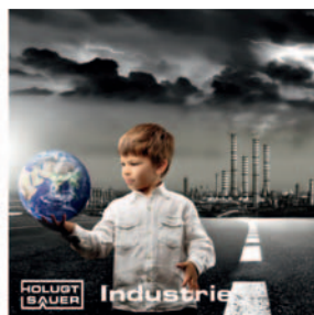
HOLUGT SAUER Industrie