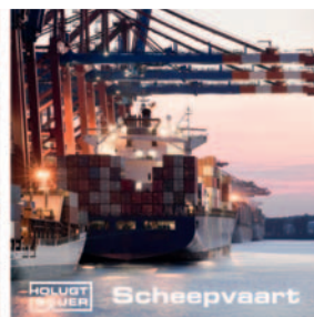
HOLUGT SAUER Scheepvaart