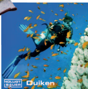
HOLUGT SAUER Duiken